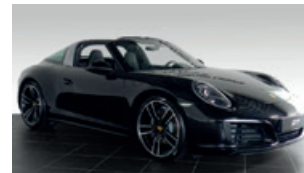
Porsche Zentrum Leipzig www.porsche-leipzig.de