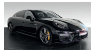
Porsche Zentrum Leipzig www.porsche-leipzig.de