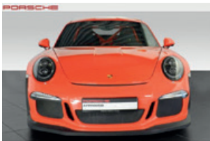
Porsche Zentrum Leipzig www.porsche-leipzig.de