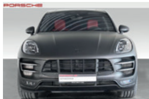
Porsche Zentrum Leipzig www.porsche-leipzig.de