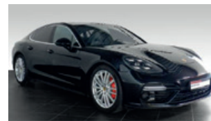
Porsche Zentrum Leipzig www.porsche-leipzig.de