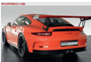
Porsche Zentrum Leipzig www.porsche-leipzig.de

Porsche 911 Carrera S Cabriolet · Kraftstoffverbrauch (in l/100 km): innerorts 12,3–10,2 · außerorts 6,7–6,5 · kombiniert 8,8–7,8; CO 2 -Emissionen kombiniert 202–178 g/km