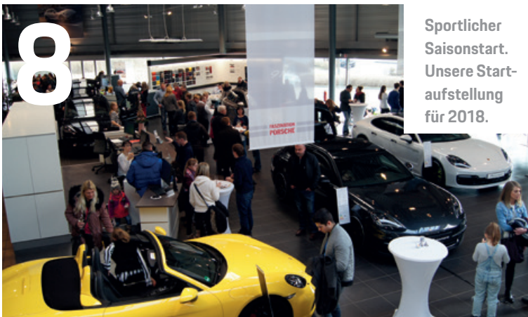
Sportlicher Saisonstart. Unsere Start- aufstellung für 2018.