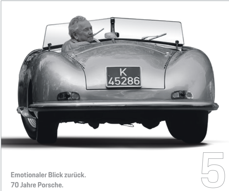
Emotionaler Blick zurück. 70 Jahre Porsche.