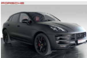
Porsche Zentrum Leipzig www.porsche-leipzig.de