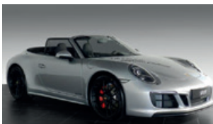
Porsche Zentrum Leipzig www.porsche-leipzig.de