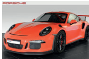
Porsche Zentrum Leipzig www.porsche-leipzig.de