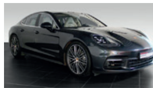
Porsche Zentrum Leipzig www.porsche-leipzig.de