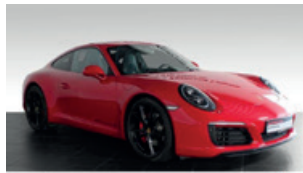
Porsche Zentrum Leipzig www.porsche-leipzig.de