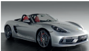
Porsche Zentrum Leipzig www.porsche-leipzig.de

Kraftstoffverbrauch (in l/100 km): innerorts 12,6–12,4 · außerorts 8,0–7,8 · kombiniert 9,7–9,5; CO 2 -Emissionen kombiniert 224–219 g/km · Effizienzklasse E