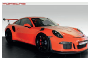
Porsche Zentrum Leipzig www.porsche-leipzig.de