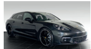
Porsche Zentrum Leipzig www.porsche-leipzig.de

Porsche 718 Boxster S mit PDK, 257 kW (350 PS), EZ 09/17, 8.900 km, GT-silbermetallic, Lederausstattung Bi-Color inkl. Sitze schwarz-bordeauxrot, LED-Hauptscheinwerfer inkl. Porsche Dynamic Light System Plus (PDLS+), ParkAssistent vorne und hinten inkl. Rückfahrkamera, BOSE® Surround Sound-System, Connect Plus, GT-Sportlenkrad, Sport Chrono Paket inkl. Mode-Schalter, Sport-Design Paket, Sportabgasanlage (inkl. Sportendrohre silber), Spurwechselassistent, Tempolimitanzeige, Tempostat, Windschutzscheibe mit Graukeil, 20-Zoll Turbo Rad u. v. m., MwSt. ausweisbar, EUR 77.800,-