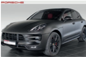
Porsche Zentrum Leipzig www.porsche-leipzig.de