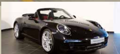
PORSCHE 911 CARRERA CABRIOLET | EUR 150.100,00*

Anthrazitbraunmetallic, Lederausstattung inkl. Sitze luxorbeige, 195 kW/265 PS, 20-Zoll Carrera S Rad, BOSE® Surround Sound-System, ParkAssistent vorne und hinten, PDK u.v.m.