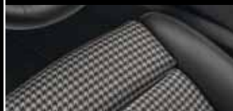
Liebvolle Reminiszenz: Die Sitzmittelbahnen greifen das Pepita-Muster auf, das in den ersten 911 Modellen stilbildend war.