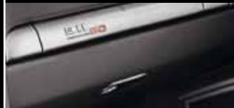
Oberhalb des Handschuhfachs zeigt eine Plakette die Limitierungsnummer an.