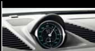
Design-Zitat: Bis 1967 war die Ziffern- und Skalenfarbe der Instrumente grün und die Zeiger weiß.

Schon von außen ist die klassische 911 DNA unverkennbar: z. B. an den rund ausgeformten Scheinwerfern und den Lufteinlasslamellen. Im Jubiläumsmodell sind sie zusätzlich mit Chrom akzentuiert, genau wie das Heckdeckelgitter hinten. Es verrät, wo der Motor sitzt: Sechs Zylinder, in Boxeranordnung, inklusive typischem Porsche Sound. So weit die Tradition. Doch kommen wir zur Zukunft: Denn mit dem Motor des Porsche 911 Carrera S bewegt sich das Jubiläumsmodell eindeutig auf dem neuesten Stand der Zeit. Mit 3,8 Litern Hubraum entwickelt der Motor eine beeindruckende Leistung von 294 kW (400 PS). So beschleunigt das