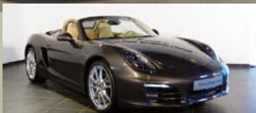
PORSCHE BOXSTER | EUR 76.700,00*

Anthrazitbraunmetallic, Lederausstattung inkl. Sitze luxorbeige, 195 kW/265 PS, 20-Zoll Carrera S Rad, BOSE® Surround Sound-System, ParkAssistent vorne und hinten, PDK u.v.m.