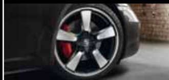
Nicht nur von Sammlern hochbegehrt: die Sport Classic Räder im legendären Fuchselgendingen.

Jubiläumsmodell 50 Jahre 911 mit 7-Gang-Schaltgetriebe in 4,5 s von 0 auf 100 km/h und erreicht eine Höchstgeschwindigkeit von 298 km/h. Ebenfalls zukunftsweisend sind die Verbrauchswerte, die der hohen Leistung des Jubiläumsmodells gegenüberstehen: Denn mit 8,7 l/100 km (in Verbindung mit dem optionalen PDK) liegen sie vergleichsweise niedrig. Grund dafür sind serienmäßige Effizienztechnologien wie Auto Start-Stop-Funktion, Thermomanagement oder Bordnetzrekuperation, die auch im Jubiläumsmodell 50 Jahre 911 integraler Bestandteil des Fahrzeugkonzepts sind.