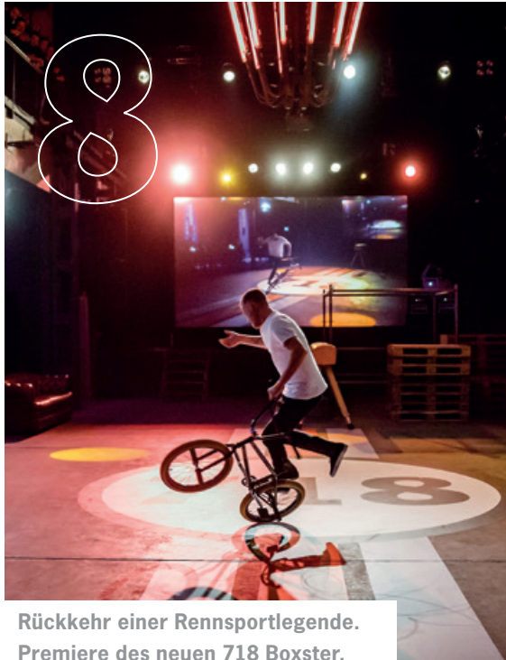
Rückkehr einer Rennsportlegende. Premiere des neuen 718 Boxster.