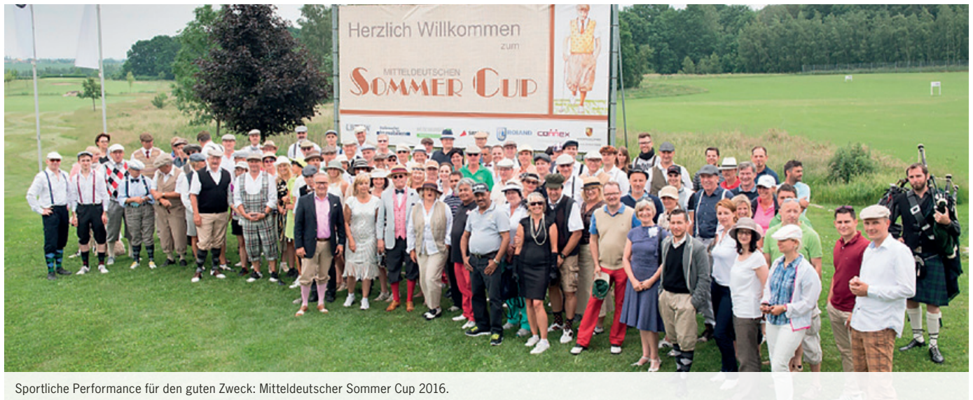
Sportliche Performance für den guten Zweck: Mitteldeutscher Sommer Cup 2016.