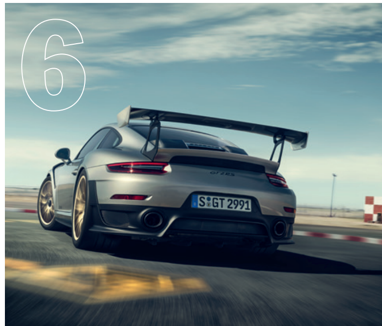
Lässt seinen Worten Taten folgen. Der neue 911 GT2 RS.