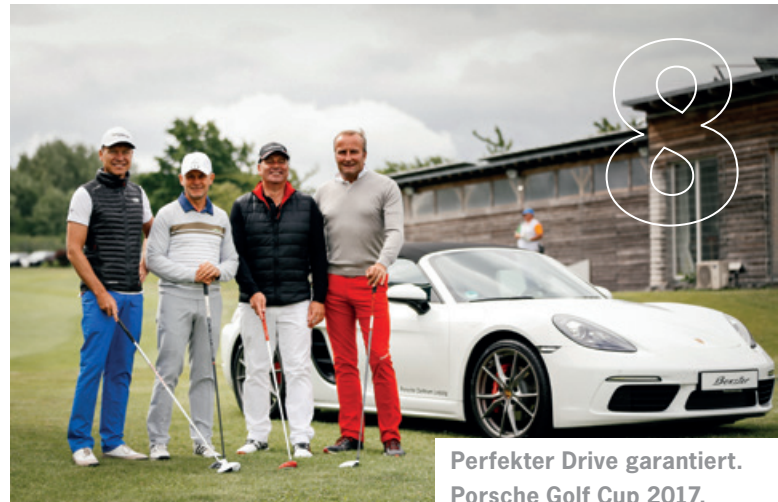
Perfekter Drive garantiert. Porsche Golf Cup 2017.