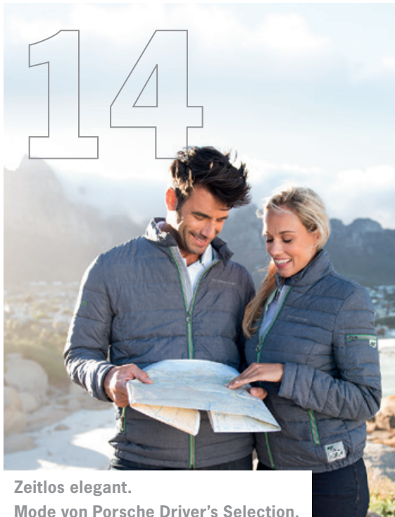
Zeitlos elegant. Mode von Porsche Driver's Selection.