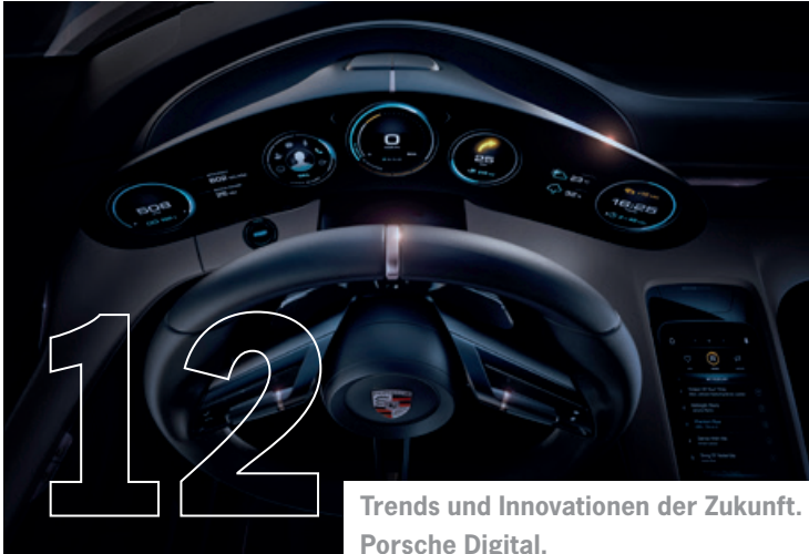
Trends und Innovationen der Zukunft. Porsche Digital.