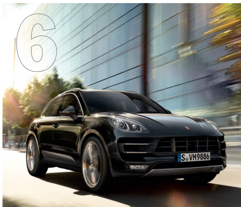
Manchmal ist im Leben keine Zeit für Kompromisse. Der neue Macan Turbo mit Performance Paket.