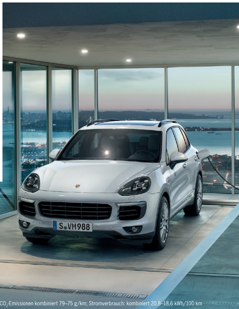
Porsche Cayenne S E-Hybrid · Kraftstoffverbrauch (in l/100 km): kombiniert 3,4–3,3; CO 2 -Emissionen kombiniert 79–75 g/km; Stromverbrauch: kombiniert 20,8–18,6 kWh/100 km

Mit Porsche E-Performance formulieren wir schon heute Antworten auf die Fragen von morgen, und setzen dort an, wo wir tatsächlich etwas verändern können: in der Garage, im Alltag unserer Fahrer – mit einem durchdachten Gesamtkonzept, das die Bereiche Fahrzeug, Energie und Konnektivität umfasst.