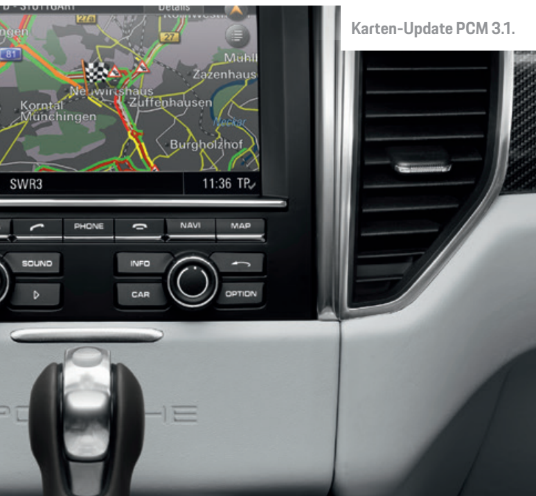
Karten-Update PCM 3.1.