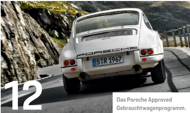
Das Porsche Approved Gebrauchtwagenprogramm.