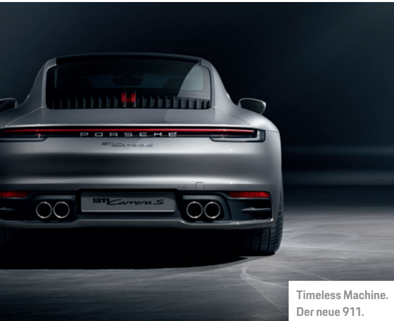
Timeless Machine. Der neue 911.